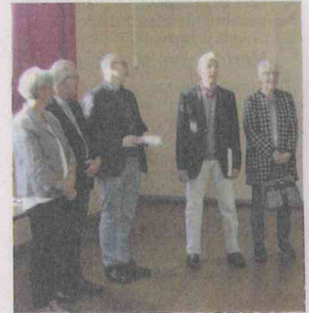
La remise de chèque s'est déroulée le 13 mai à Juvignies.