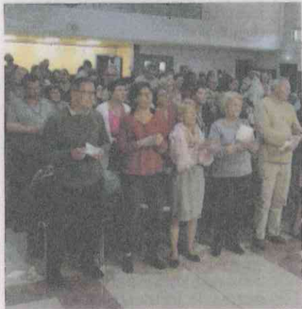
Standing ovation pour la chorale Limyé'A, le 11 mai à la salle multifonctions.